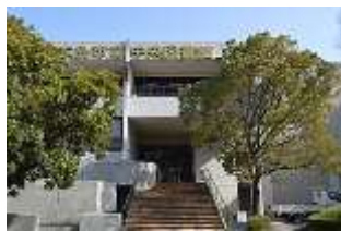
広島市立中央図書館