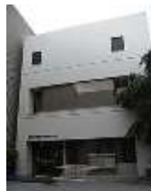
広島映像文化ライブラリー