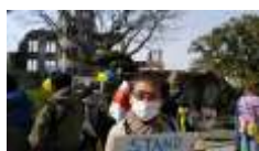
ウクライナ侵攻反対運動 (原爆ドームにて)

ロシアのウクライナ侵攻で、世界中に衝撃が走りまわりました。テレビやSNS等を通して、悲惨な状況がリアルタイムで届けられ、まさに「今、ここで起こっていること」が伝わるので、その恐怖たるや。お年寄り、女性、子どもが近隣国に避難している様子には、なんとか無事でいてほしいと祈るばかりです。広島市は各区役所をはじめ各所に緊急の募金箱を設置しました。5月中旬には取りまとめ、日本赤十字社を通して支援することになっています。