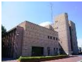
広島市こども図書館