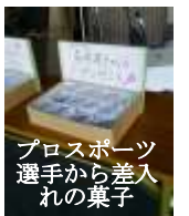
プロスポーツ選手から差入れの菓子

土日は土砂かきに600人余りのボランティアが来られました。北は北海道、南は沖縄から。「看護師です、お手伝いします」と連絡が入り、そして本当に来てくれています。それらは驚くことなので、見も知らない誰かが色々な方法で助けてくれているのです。ありがたいの一言です。