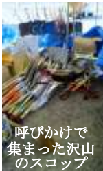
呼びかけで集まった沢山のスコップ

被災地となった場所は広島市では安佐北区、安芸区、東区、南区です。それぞれ災害ボランティアセンターができ、毎日、全国各地から多くの方が土砂かきに来て下さいます。炎天下での肉体労働なので熱中症が一番心配です。何かあったとき、迅速に対応するために看護師の観察力や技が必要です。