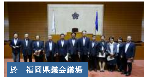
於 福岡県議会議場

単なる理念だけの条例、実際に県民のニーズにこたえた条例等様々です。広島市議会にも政策チームを作って市民の皆さんにとって本当に意味のある条例を作りたいと思いました。