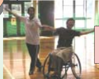
心身障害者福祉センター 車いすダンス同好会 見学