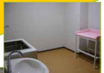
使いやすくなった 外来のおむつ交換スペース